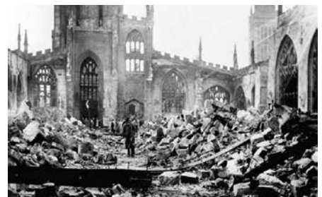
Una catedral de Londres destruida por las bombas