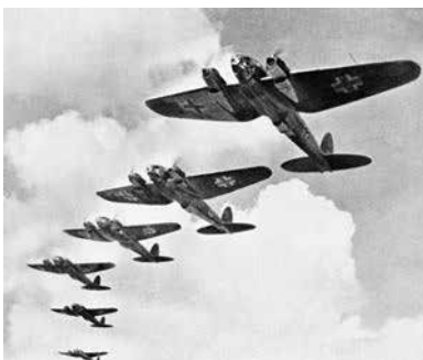
Bombarderos alemanes rumbo a Inglaterra