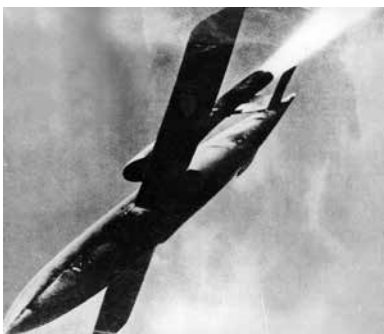
V1 "Zumbadora" lanzada desde Francia.

Desde 1941 al 44, casi un millón de casas fueron destruidas y unas 45.000 personas murieron bajo las bombas nazis en el vano intento de quitar a Inglaterra de la Segunda Guerra Mundial o hacerla vulnerable a una invasión.