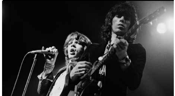
En 1962, Keith y Mick fundaron los Rolling Stones.