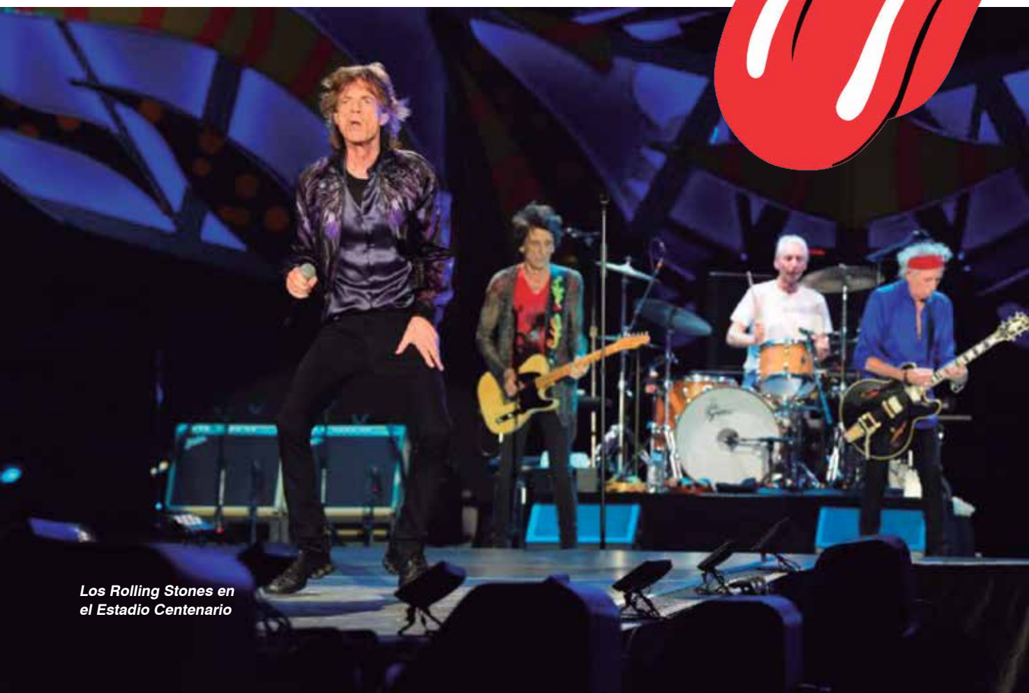
Los Rolling Stones en el Estadio Centenario