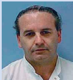
Dr. Alex Acosta